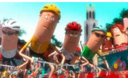
Grand Départ Utrecht animation

Dans le domaine sportif, Utrecht est connue pour avoir donné naissance à Marco van Basten et au pionnier du judo européen Anton Geesink. Mais, au pays roi de la bicyclette, la ville qui créa la première piste cyclable en 1895 ne pouvait manquer d'abriter