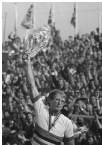
Jan Raas, champion du monde 1979