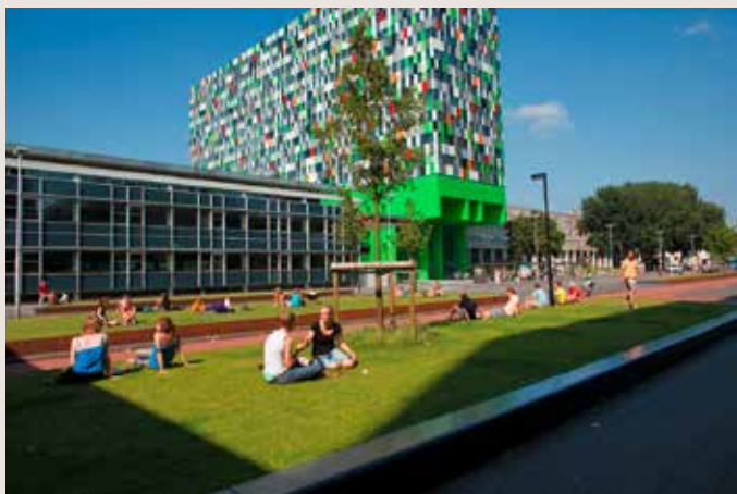
Casa Confetti, université d'Utrecht