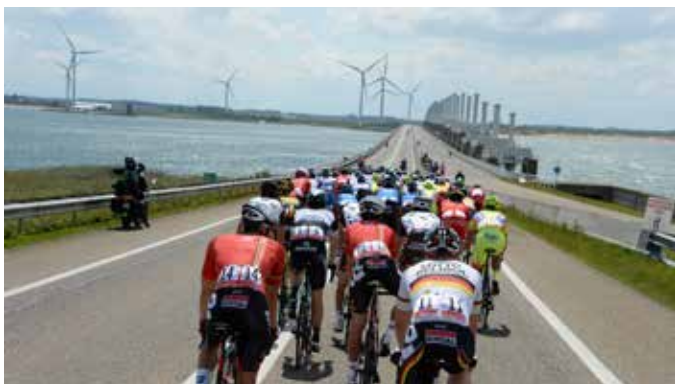
La World ports Classic

Festivals : Concert at Sea (rock), Zeeland Nazomerfestival (théâtre et danse), Film by the Sea, Zeeuwsch Vlaanderen Festival (musique classique)