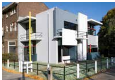
La Maison Schröder

Installé depuis 1921 dans un ancien monastère classé, le musée retrace l'histoire de la ville et abrite une riche collection de peintres de l'école caravagesque d'Utrecht (XVII e siècle).