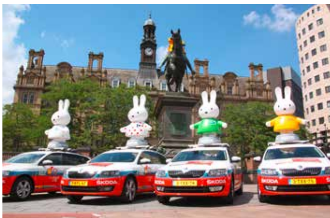
Miffy (Nijntje en néerlandais)

vacances un jour de pluie. Miffy a alors évolué avec le temps pour devenir cette petite lapine aux oreilles dressées connue mondialement. Pourquoi une fille ? Tout simplement parce que Dick