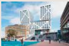
Le nouvel hôtel de ville et la gare d'Utrecht