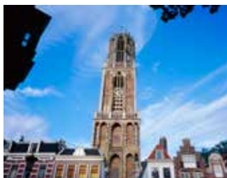
La tour de la cathédrale

Ne cherchez pas la vedette de ce grand départ dans le peloton. La véritable star d'Utrecht, qui sera évidemment la mascotte de ce préambule du Tour 2015, est une petite lapine blanche aux yeux noirs qui fête ses 60 ans cette année : Miffy (Nijntje en néerlandais). Créée par le dessinateur d'Utrecht Dick Bruna, ses albums se sont depuis 1982 écoulés à plus de 85 millions d'exemplaires. Dick Bruna l'avait d'abord dessinée pour amuser son fils qui s'ennuyait en