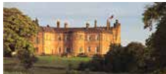
Ripley, une visite passionnante.

Propriété des Ingilby depuis 700 ans, le château de Ripley est l'objet d'une visite passionnante racontant la vie de cette famille sur 26 générations. La vieille tour de 1555 regorge de mobilier, d'armures et de vaisselle conservés par la famille au cours des siècles.