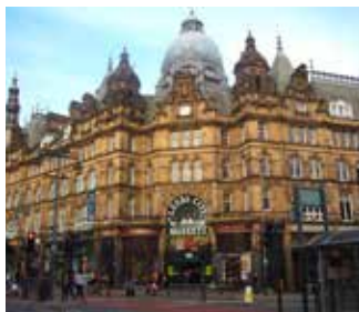
Le plus grand marché couvert d'Europe.