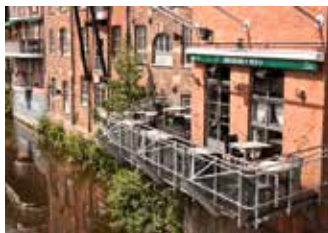
Brasserie Forty Four.