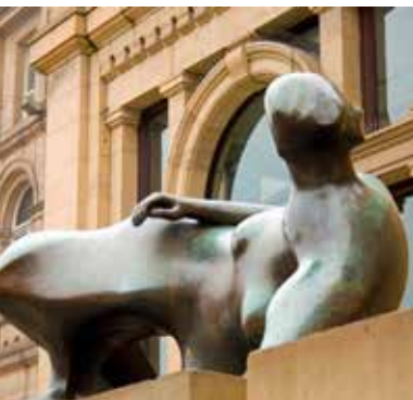
Fondation Henry Moore.