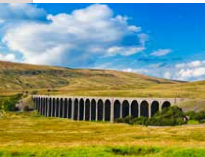
Les Yorkshire Dales.

Sa riche histoire a fait du Yorkshire une terre à part au sein du Royaume-Uni, à la forte identité façonnée par les peuples qui s'y sont succédé, les industries qui l'ont enrichie et les