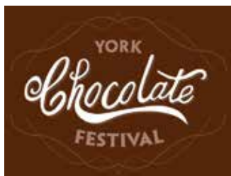
Capitale du chocolat.

York a accueilli à plusieurs occasions le peloton professionnel anglais lors du Tour de Grande-Bretagne (sous ses diverses appellations : Milk Race, Prudential Tour...). La dernière visite remonte à 2009, pour une étape remportée par l'Australien Chris Sutton. Les Australiens ont d'ailleurs brillé dans « l'autre capitale de l'Angleterre » puisque, en 1998, c'est Stuart O'Grady qui