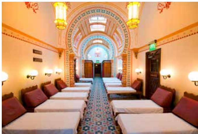
Le Spa anglais.

construits la buvette, connue sous le nom de Royal Pump Room, et les bains, ou Royal Bath Assembly Room. Au plus fort du succès du thermalisme, quelque 60 000 curistes affluaient chaque année dans la ville. Harrogate fut également l'une des premières villes à bénéficier d'un éclairage au gaz grâce au procédé mis au point par l'ingénieur Samson Fox. Si la vogue des bains retomba après la Première Guerre mondiale, Harrogate reste considérée comme l'une des villes d'Angleterre bénéficiant de la meilleure qualité de vie. C'est aujourd'hui un centre de congrès et de salons.