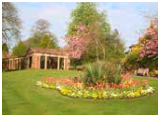
Les jardins de Harlow Carr.