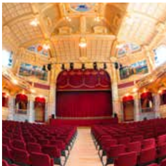
Royal Hall Theatre.