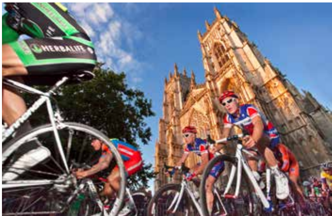
Cathédrale de York.

l'emportait à York dans la deuxième étape du Prudential Tour avant de s'y imposer au classement général. La ville a également accueilli de multiples épreuves aujourd'hui disparues comme le critérium d'York ou une course Londres-York organisée dans les années 1970.